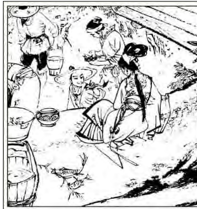
5. 池中本来有不少鱼, 这场火灾, 使得无辜的鱼儿遭了殃。有些鱼在人们救火时被舀进水桶, 投入烈火之中烧死; 剩下的鱼儿失去了水, 或死在干涸的池底, 或被人们捞进水桶带回家去。