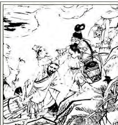
3. 护城河(古时也称作“池”)是附近唯一的水源。人们都从中汲水灭火, 你来我往, 川流不息。