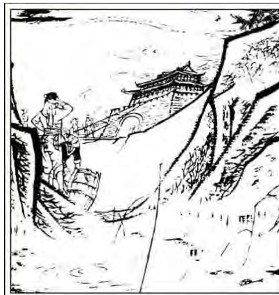
4. 大火总算被扑灭了。这时候, 池水也被舀干。