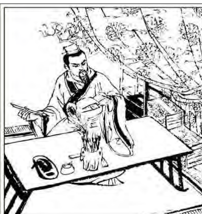
6. 北齐的杜弼, 写过一篇《为东魏檄梁文》, 文中用“城门失火, 殃及池鱼”一语来比喻无端受祸。这句话后来成了人们常用的成语。(完)