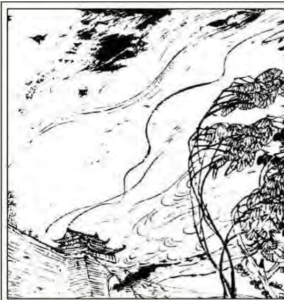
1. 古时候, 宋国的一座城门失了火。烈火熊熊, 浓烟滚滚。