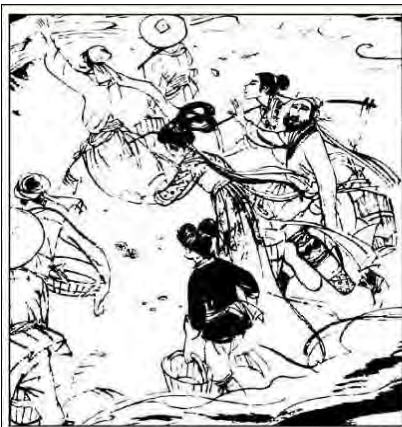
2. 人们知道城门失火了, 纷纷提着水桶等盛水工具赶来救火。